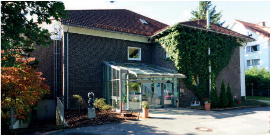
Das Haus der Tagespflege