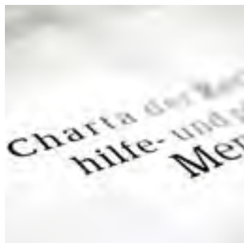
Die Charta der Rechte hilfe- und pflegebedürftiger Menschen umfasst acht Artikel.

Seit 1995 haben sich in der stationären Altenpflege die Pflege- und Betreuungsschlüssel im Grunde überhaupt nicht verändert und verbessert. Gleichzeitig ist der Pflegebedarf in den Einrichtungen gestiegen und die Menschen, die zu uns kommen, haben in der Regel mehrfache Erkrankungen oder sind dement. Das bedeutet: Im stationären wie auch im ambulanten Bereich findet Pflege unter einem erheblichen Zeitdruck statt. ►