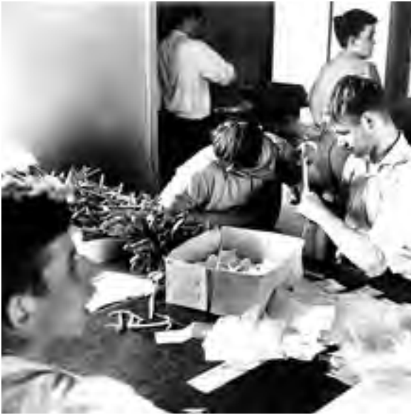
Bewohner packen 1967 in der Werkstatt Löffel ab.