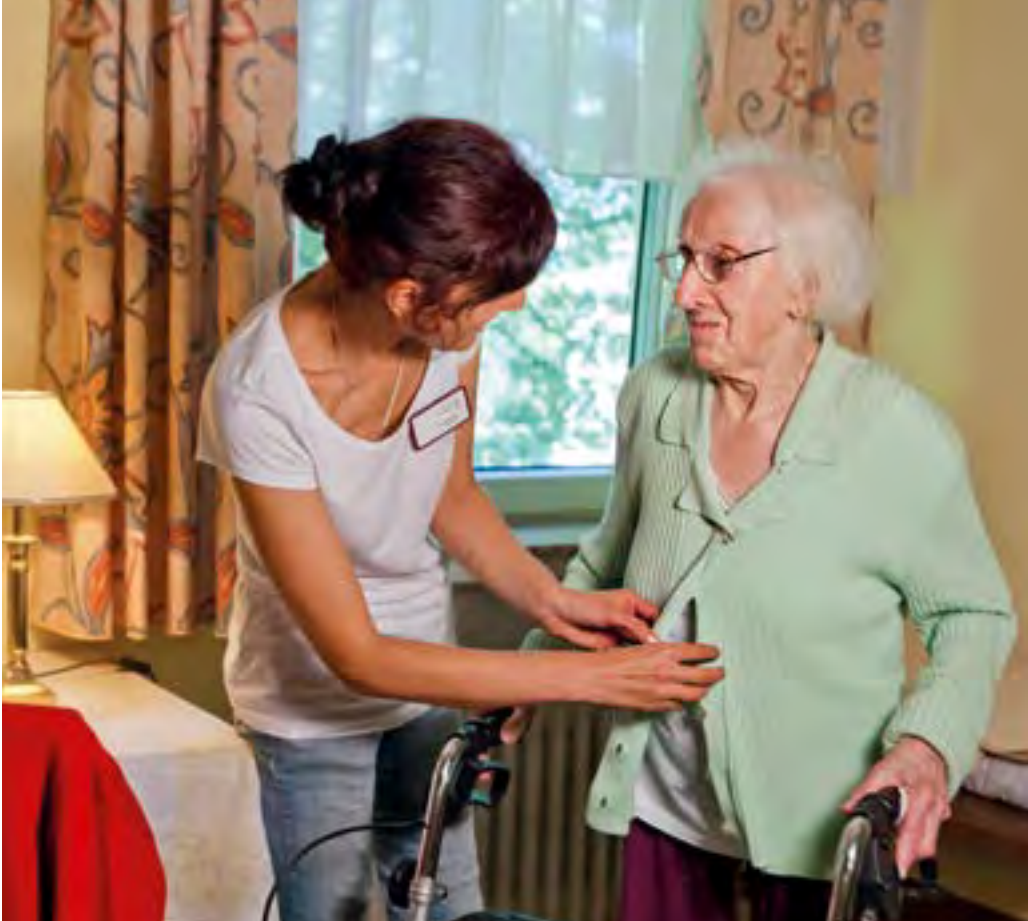
Selbstbestimmt: In stationären Altenhilfe-Einrichtungen des Johanneswerks werden individuelle Wünsche berücksichtigt, Autonomie hat einen hohen Stellenwert.