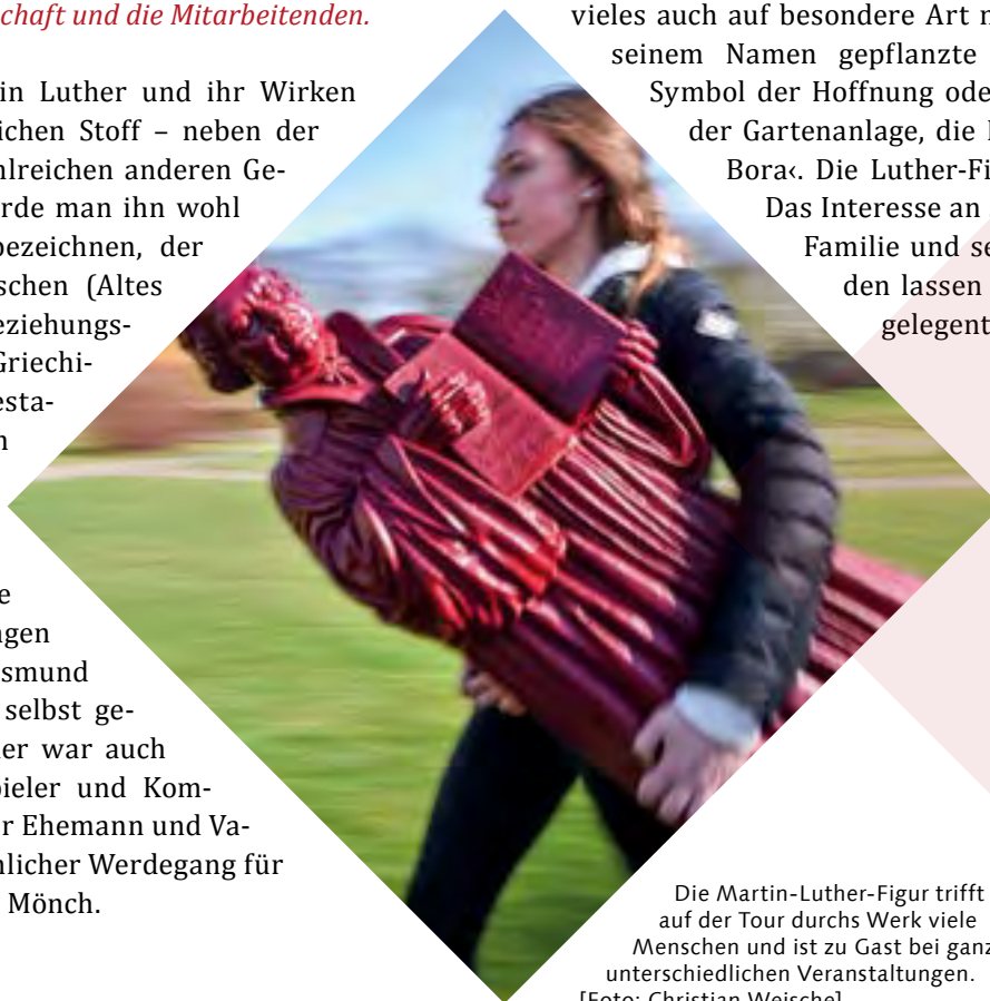
Die Martin-Luther-Figur trifft auf der Tour durchs Werk viele Menschen und ist zu Gast bei ganz unterschiedlichen Veranstaltungen.