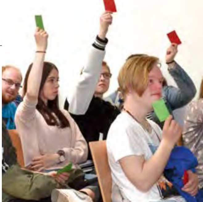
Inklusives Meinungsbild: Mit grünen und roten Karten zeigen die Teilnehmenden der Tagung Zustimmung oder Ablehnung.