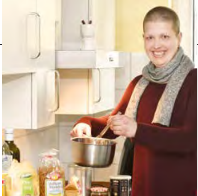
Gesunde und zum Teil auch exotische Zutaten stehen seit der Krebs-Diagnose auf dem Essensplan.