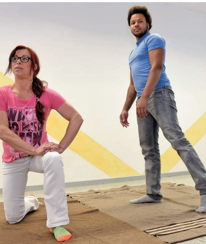
Position fünf: Ein Bein aufgestellt, beide Hände auf dem Oberschenkel aufstützen. Der Händedruck unterstützt die Bewegung in den Stand.