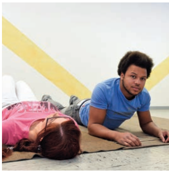
Die sechs Positionen des Aufstehens nach Kinästhetik-Grundsätzen: Aus der Rückenlage (I.) dreht sich der Mensch in die Bauchlage.