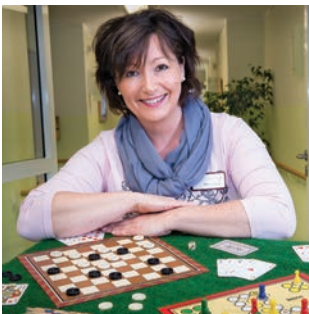
[Titelbild: Christian Weische]