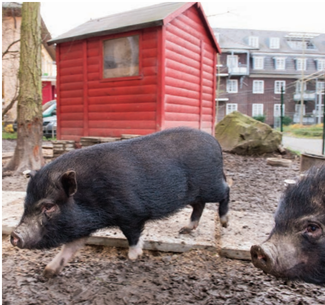
Die Minischweine Lilli und Franz haben direkt am Theodor-Fliedner-Heim ein Gehege bezogen, das ein magischer Anziehungspunkt für Jung und Alt ist.