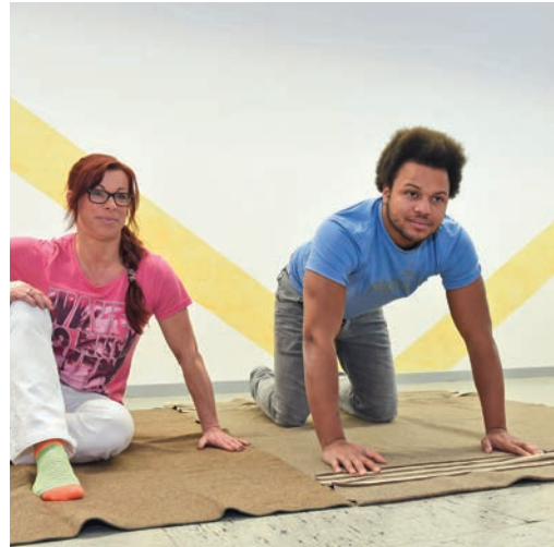
Die dritte Position ist die Sitzposition (links). Aus dieser geht's in den Vierfüßler-Stand (das Gesicht wäre eigentlich zur Wand gerichtet).

Je mehr eigenes Bewegungspotenzial der Kinästhetik-Anwender entdeckt und durch Worte oder kleine Hilfen aktiviert, umso einfacher wird für ihn die Pflege. Selbst Angehörige können sich über die Kinästhetik Möglichkeiten erschließen, dem Pflegebedürftigen in ihrer Familie gezielt zu helfen. Transfer vom Bett in den Rollstuhl oder vom Rollstuhl auf den Hocker in der Dusche – es gibt zahlreiche Gelegenheiten, wo sie das Bewegungskonzept anwenden können.