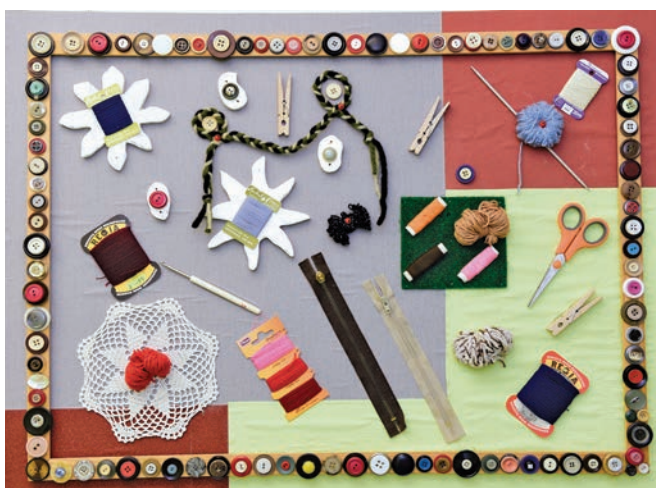
Ein Sammelsurium von Näh- und Handarbeitsutensilien fügt sich – von einer Knopfleiste gerahmt – zu dieser Collage zusammen.

Wohnbereich AB 2, auf dem Flur zum Gemeinschaftsraum: Eine Bewohnerin steht vor einem farbenfrohen Frühlingsbild, hat die Struktur eines echten Rindenstücks betastet und taucht jetzt mit den Fingern tief in die Borsten eines Handfegers ein. Das entspannte Lächeln gibt den Hinweis: Da wird eine Erinnerung greifbar. Und binnen kurzer Zeit entspinnt sich zwischen der begleitenden Betreuungskraft und der Bewohnerin ein Gespräch.