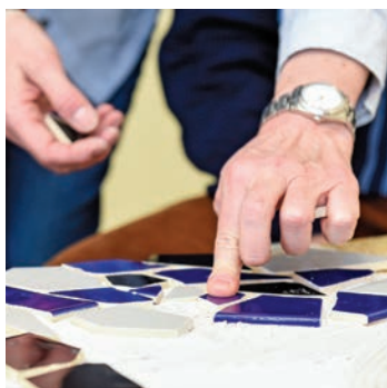
Schwarz, Weiß, Blau: Die Vereinsfarben von Arminia Bielefeld.