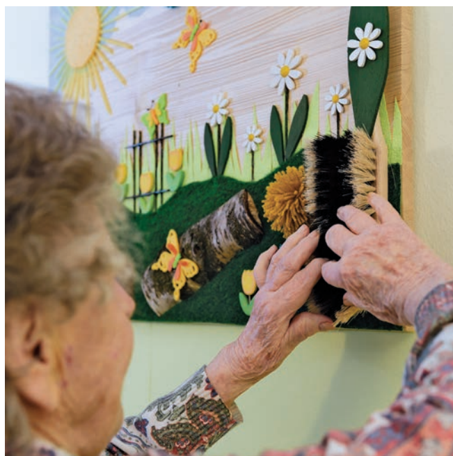
Echte Baumrinde und ein Handbesen laden beim Frühlingsbild zum Anfassen ein – und wecken Erinnerungen.