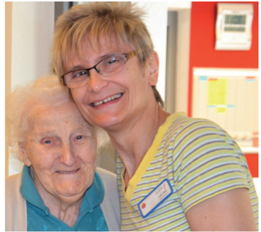
Eine Bezugsperson steht jedem Bewohner zur Seite

Im Karl-Pawlowski-Altenzentrum betreut ein multiprofessionelles Team pflegebedürftige Menschen. Die Bedürfnisse der Menschen sind dabei so unterschiedlich wie die Menschen selbst. Daher steht in unserer Einrichtung die Individualität des Bewohners im Mittelpunkt. Pflege und Betreuung finden immer mit dem Schwerpunkt auf Selbstbestimmung und größtmögliche Selbstständigkeit statt.