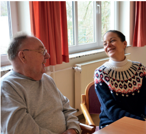
Zeit für eine kleine Pause

Die aktuellen Pflegesätze für das Karl-Pawlowski-Altenzentrum entnehmen Sie dem beigefügten Informationsblatt.