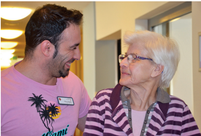
Begegnungen zwischen Alt und Jung

Im Mittelpunkt all unserer Tätigkeiten steht stets, ein Höchstmaß an Wohlbefinden und Lebensqualität zu erzielen und den Erhalt der Gesundheit unserer Bewohner zu unterstützen.