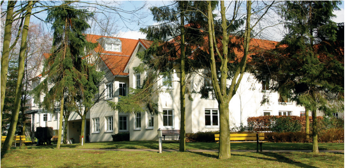
Das Karl-Pawlowski-Altenzentrum – ein Ort der Geborgenheit

Inmitten eines kleinen Parks findet sich im Osten Recklinghausens das Karl-Pawlowski-Altenzentrum. Das Haus ist ruhig und idyllisch am Ende einer Sackgasse gelegen, Einkaufsmöglichkeiten sowie eine Apotheke befinden sich in fußläufiger Entfernung. Die Anbindung an den öffentlichen Nahverkehr rückt auch das Stadtzentrum in gut erreichbare Nähe.