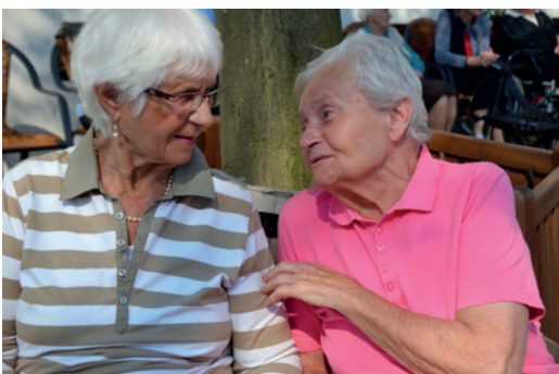
Ein Plausch unter Freundinnen

Eine architektonische Besonderheit liegt im Erdgeschoss: das große Atrium. Von einer Glaskuppel überdacht bildet es einen lichtdurchfluteten Mittelpunkt des gesamten Gebäudes.