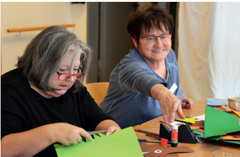
Freude am Kreativsein

Im Erdgeschoss befindet sich ein offener Innenhof. Hier können Bewohner und Besucher – innerhalb der Einrichtung und gleichzeitig doch unter freiem Himmel – die Sonne genießen.